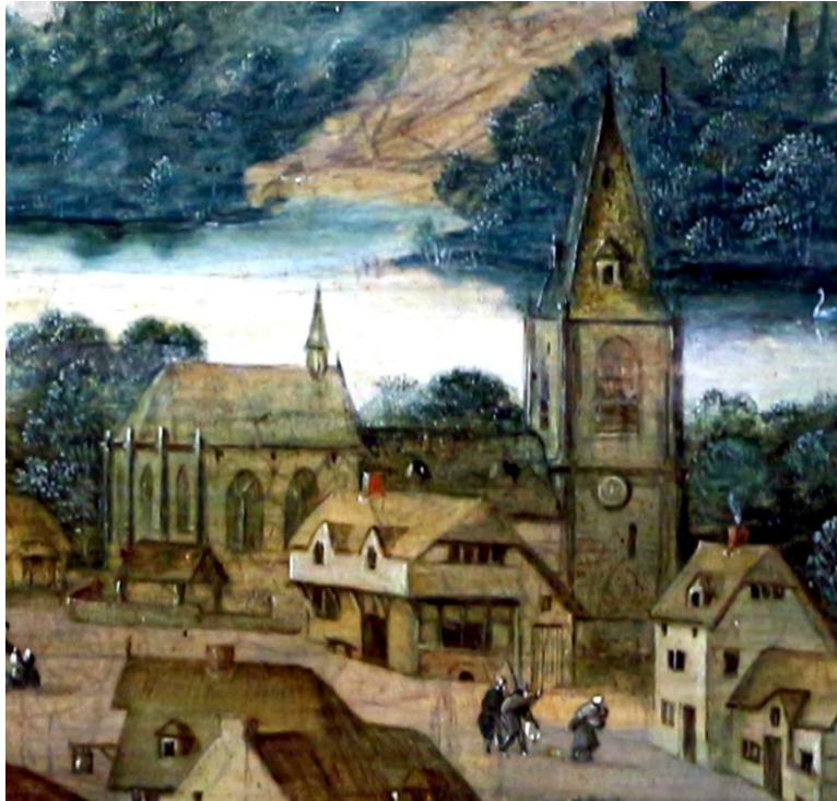
3. De kerk van het dorp (detail uit Vlucht naar Egypte)

Wanneer we de kerk dichterbij halen (afb.3), blijkt het een merkwaardig bouwsel te zijn. Het van oorsprong eenvoudige Romaanse gebouw is uitgebreid met een verhoogd, gotisch priesterkoor. Men heeft daarbij geen enkele moeite gedaan de twee stijlen met elkaar te verweven. Het zijn twee gebouwen, die pardoes tegen elkaar zijn geplaatst. Ook al lijkt dit op het eerste oog vreemd, in de 15 e en 16 e eeuw was dit niet ongebruikelijk. Met de groei van de bevolking werd de veelal romaanse kerkruimte (in dorpen moeten we eerder spreken van een kapel) te klein. Uitbreiding met een gotische constructiewijze ging relatief snel, bood meer licht en ruimtelijke mogelijkheden en beantwoordde daarnaast aan een gevoel van moderniteit. Het was niet alleen het ruimtegebrek, maar ook de kerkbranden waren niet zelden een reden tot verbouwing en vernieuwing. Veel van dergelijke verbouwde kerken uit de 15 e en 16 e eeuw hebben de tand des tijds niet doorstaan, maar gelukkig zijn er vandaag de dag nog enkele voorbeelden te zien in Dennenburg (Ravenstein), Barneveld, Eethen, Schin-op-Geul, Pieterburen en Leur (Nijmegen). Voor de verdwenen gebouwen (zoals de kerk van Aalst) zijn we aangewezen op oude architectuurboeken, archieven en schilderijen. Het zijn gebouwen die we nu als een tijdsbeeld van een groeiende geloofsgemeenschap kunnen zien. Voor de bewoners van de dorpen was het een stenen bewijs daarvan, met een duidelijk groeipatroon van klein naar groot en van laag naar hoog: