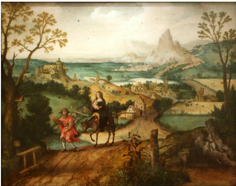
1. Lucas Gassel, Vlucht naar Egypte , 1542, olieverf op paneel 67,5x88,5 cm. Bonnefantenmuseum Maastricht

Het gesigneerde en gedateerde paneel is sinds 1953 te bewonderen in het Bonnefantenmuseum van Maastricht dankzij een langdurig bruikleen van de Rijksdienst voor het Cultureel Erfgoed.