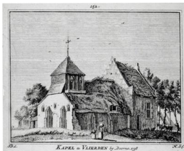
6. Hendrik Spilman, Kapel van Vlierden , 1738