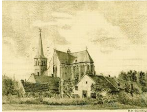
5. Hendrik Ouwering, Willibrorduskerk Deurne , 1876